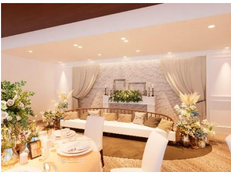
リニューアルパース (写真はイメージです)

リニューアルオープンに伴い、「SOAR～ソアラ～」のご婚礼専用プランを販売します。家族や親しいご友人と肩肘を張らずに心踊るようなひとときが過ごせるように特典としてデザートビュッフェやおもてなしに欠かせないお料理のグレードアップなど3つのオプションより1つプレゼントします。