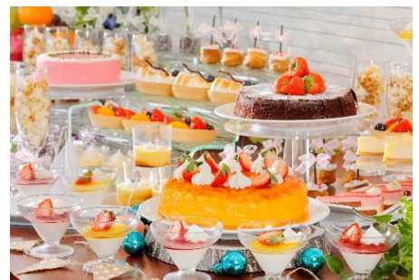
デザートビュッフェ(写真はイメージです)