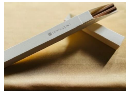
東鳳オリジナル箸「HACOHASHI」

【内容】お料理、お飲み物 30名さま分、音響照明料、 両家控室料、介添料、会場使用料、宴席料 (東鳳オリジナルお箸「HACOHASHI」付き) ご宿泊6名さま分サービス(1泊朝食)、 新郎新婦衣裳1着ずつ、新郎新婦洋装着付代、 ブライズルーム使用料、記念写真、チャペル挙式料