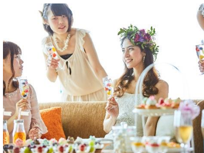
SOAR～ソアラ～での披露宴イメージ