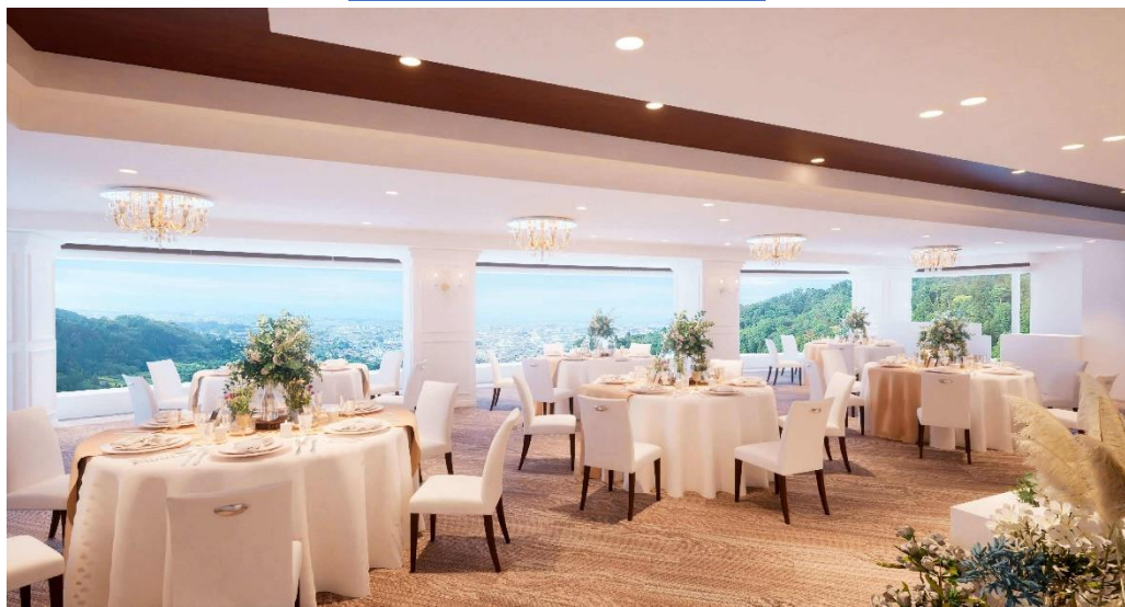
リニューアルパースイメージ (写真はイメージです)

東鳳ウェディング公式ウェブサイト： https://www.toho-wedding.jp/